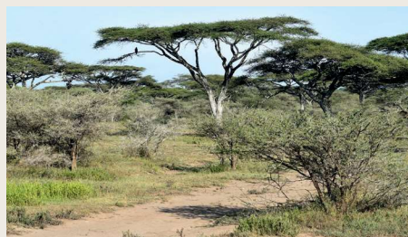
Savanna i Tanzania