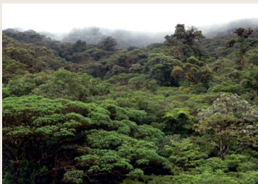
Regnskov i Nicaragua

Vand kan sive ned gennem jordlagene og blive til grundvand.