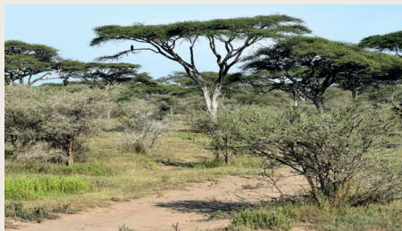
Savanna i Tanzania